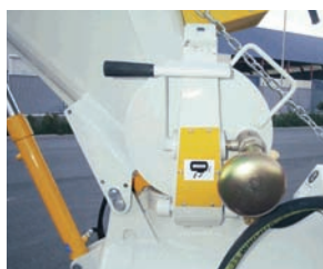
5. Nuovo coperchio con sistema di sicurezza