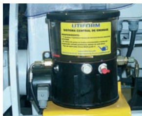
3. Ingrassaggio automatico