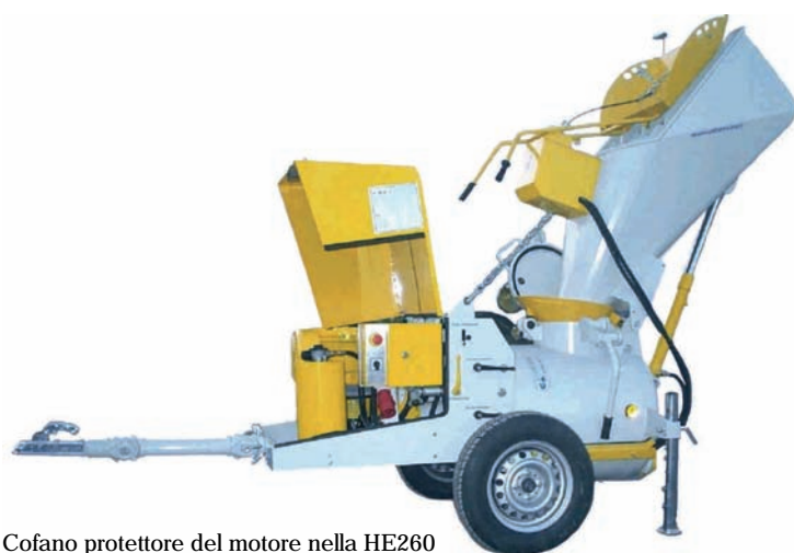
Cofano protettore del motore nella HE260