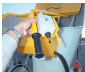
1. Telecomando a distanza per pala

Richiedere sempre pezzi di ricambio e utensili originali. Il continuo sviluppo dei nostri prodotti li rende soggetti a variazioni o modifiche tecniche senza preavviso.