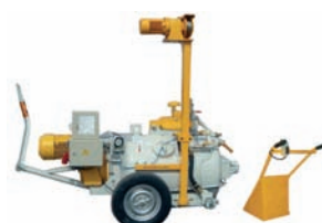
4. Versione con pala di trascinamento nella HE500